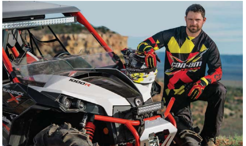
Alt i ATV-utstyr