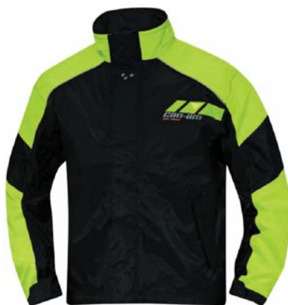
Can Am Rain Jacket - vann- og vindtett.