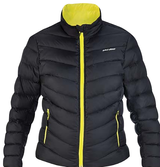
En lekker jakke fra Ski-doo.