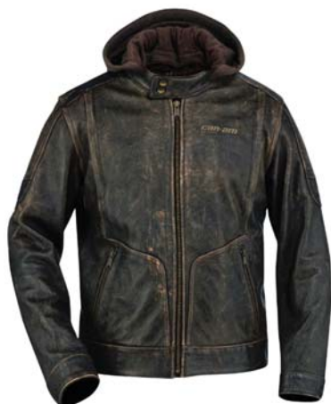
Can Am James Leather Jacket.