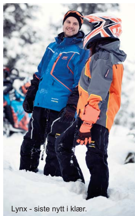
Lynx - siste nytt i klær.