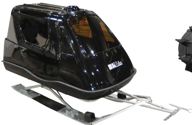
SORT PULK MED DØRER