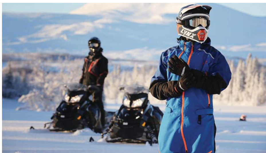
Lynx - utstyr tilpasset en norsk vinter.