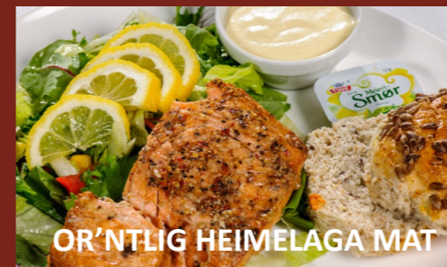
OR'NTLIG HEIMELAGA MAT