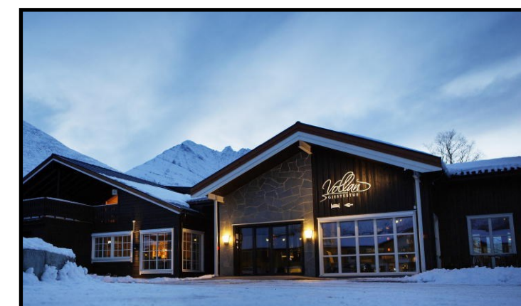
Vollan Gjestestue, anno 2016.

HOMEMADE BURGER. Ask the waiter which is today's special.