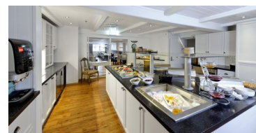
Det God Kjøkken buffet område